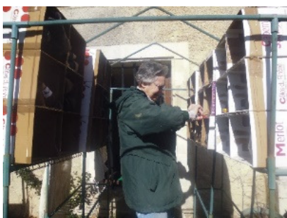
Un système de rangement élaboré pour les chaussures de sécurité

L'après-midi, élagage, désherbage le long du mur de la Bannière et transport des végétaux sur notre gros tas de branches.