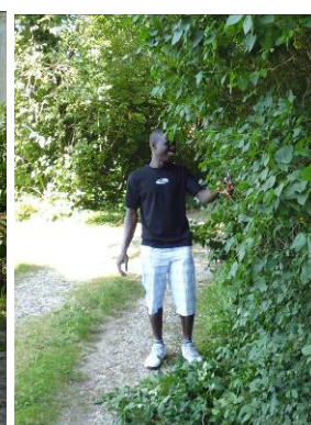
Elagage le long du chemin