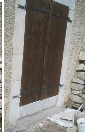
côté sud avant