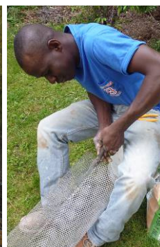
Sindou fabrique un filtre