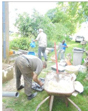
L'équipe de réparation et voilà !