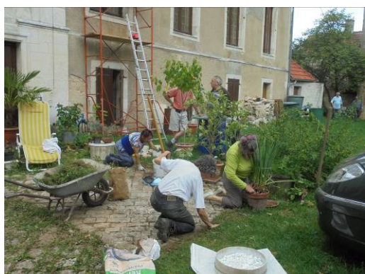
Beau pavage, mais quel travail

Le ramassage des feuilles mortes est encore en cours tout au long de l'automne.