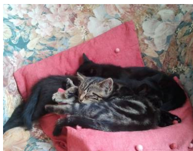
Une équipe de « supporters » toujours présente...