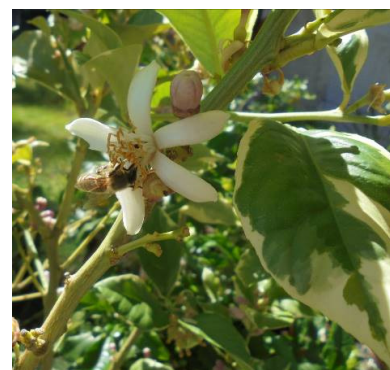
Et une belle photo de citronniers en fleurs. Merci François-Xavier !