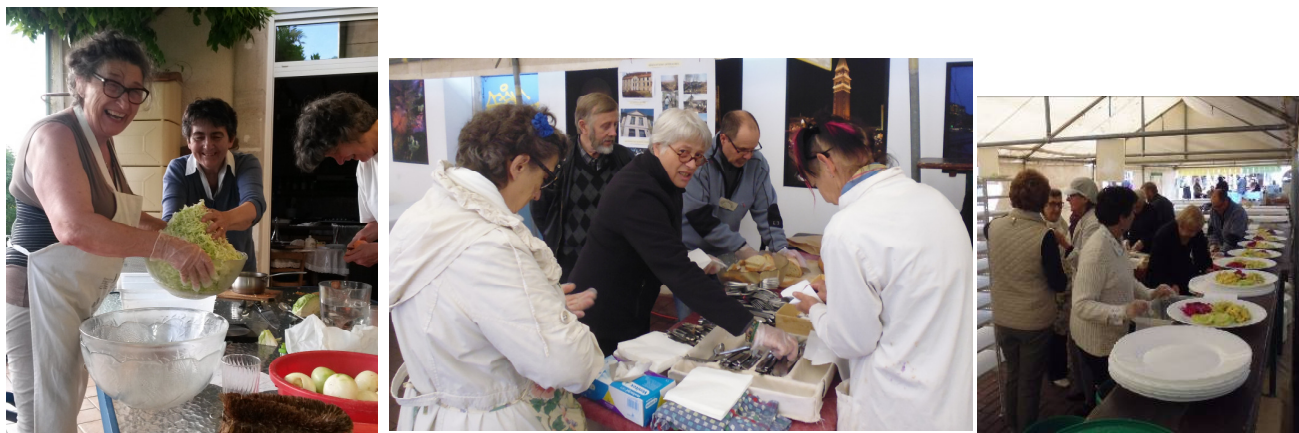
Préparatifs des entrées, tri des couverts et coupe du pain, assiettes en cours de remplissage

Comme chaque année, nous étions une bonne dizaine sur le pont les jours précédents ainsi que le jour J. Nos ventes ont été bien plus modestes que l'an passé, mais nos clients ont apprécié.