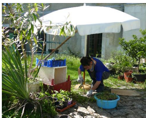
La spécialiste en action